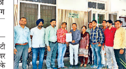
अंबाला। ज्ञापन सौंपते हारट्रोन आईटी प्रोफेशनल्स।

इस मौके पर हारट्रोन आईटी प्रोफेशनल ने उपायुक्त से अपील करते हुए कहा कि वे इस ज्ञापन को 27 जून को होने वाली कैबिनेट बैठक से पहले मुख्यमंत्री कार्यालय में भिजवाएं। उपायुक्त ने उपस्थित हारट्रोन आईटी प्रोफेशनल को आश्वास