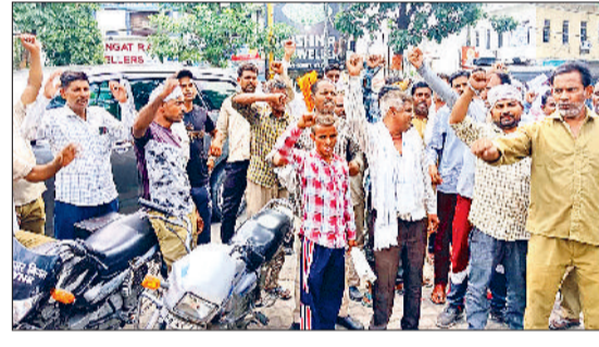
यमुनानगर में निगम कार्यालय के सामने प्रदर्शन करते सफाई कर्मचारी।

नगर निगम यमुनानगर के सफाई कर्मचारियों ने मंगलवार को अपनी लंबित मांगों को लेकर निगम कार्यालय के समक्ष दूसरे दिन भी प्रदर्शन किया। मौके पर प्रदर्शनकारियों ने निगम प्रशासन व सरकार के प्रदर्शनकारियों खिल मफ ने निगम प्रशासन व सरकार के नारेबाजी की और सरकार को जल्द पूरी नहीं की गई तो वह बड़ा आंदोलन करने पर मजबूर होंगे। उन्होंने ऐलान किया कि वह बुधवार को निगम के मुख्य लेखा