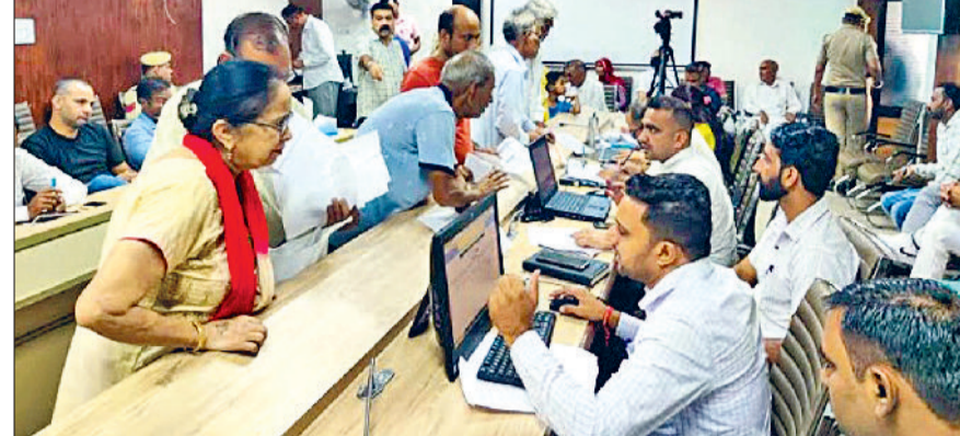
करनाल। शिकायतों का मौके पर ही समाधान करते हुए अधिकारी व कर्मचारी।

डी.सी के साथ-साथ एसडीएम स्तर के अधिकारी स्वयं समाधान शिविरों में सुबह 9 बजे से लेकर 11 बजे तक समस्याओं को सुनते हैं