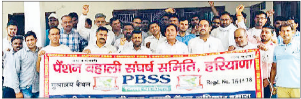
पानीपत। पेंशन बहाली संघर्ष समिति के पदाधिकारीगण अपनी मांगों को लेकर प्रदर्शन करते हुए।