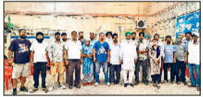
अंबाला। मीटिंग के दौरान मौजूद इनेलो नेता व कार्यकर्ता।