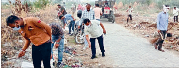
करनाल। मेगा सफाई अभियान के तहत बुढ़ाखेड़ा के बाहरी क्षेत्र की साफ-सफाई करते हुए कर्मचारी।

स्वच्छ सर्वेक्षण 2024 में स्वच्छ भारत मिशन के अंतर्गत करनाल शहर में 21 से 30 जून तक मेगा सफाई अभियान बड़े जोर-शोर से चलाया जा रहा है। इसी कड़ी में मंगलवार को वार्ड नम्बर 2 के बुढ़ाखेड़ा गांव के बाहरी क्षेत्र में सफाई अभियान चलाया गया। इस दौरान बड़ी मात्रा में पॉलिथीन उठाया गया। अतिरिक्त निगम आयुक्त धीरज कुमार ने मंगलवार को यह जानकारी दी। उन्होंने बताया कि मेगा सफाई अभियान के तहत