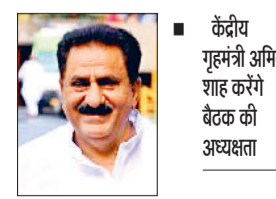
कुरुक्षेत्र। जानकारी देते शहरी स्थानीय निकाय राज्यमंत्री सुभाष सुधा।

बैठक होगी और बैठक में चुनावों के दृष्टिगत प्रदेश कार्यकारिणी सदस्यों के साथ-साथ बैठक में उपस्थित सभी को चुनाव के तहत जो कार्य करने हैं, उस बारे में उक्त मार्गदर्शन किया जाएगा। यह बैठक अत्यंत महत्वपूर्ण है तथा इस बैठक में लगभग 2500 से ज्यादा कार्यकर्ता भाग लेंगे, जिसमें चुनावी रणनीति के तहत उन्हें आवश्यक जानकारी दी जाएगी। बैठक के सफलतापूर्वक आयोजन को लेकर रूपरेखा तैयार कर ली गई है।